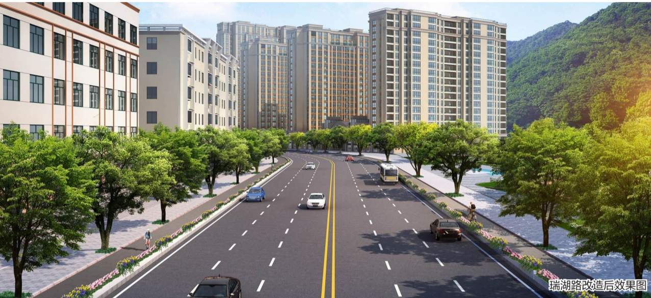
瑞湖路改造后效果图

据了解,9月25日至明年1月30日,瑞湖路(虹桥北路至商城大道)、阳光北路(商城大道至瑞祥大道)沿线因道路提升改造,实施交通限制。施工期间,两处路段道路实行双向各留一车道通行,施工封闭区域禁止通行。