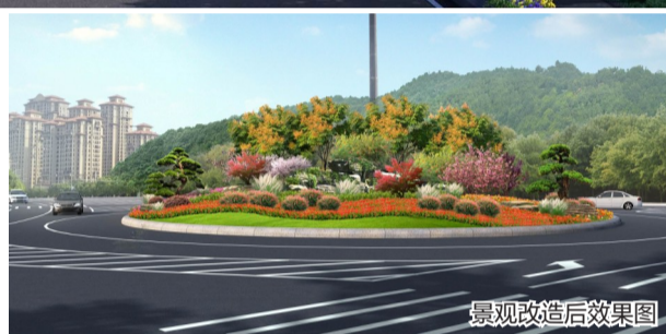
景观改造后效果图