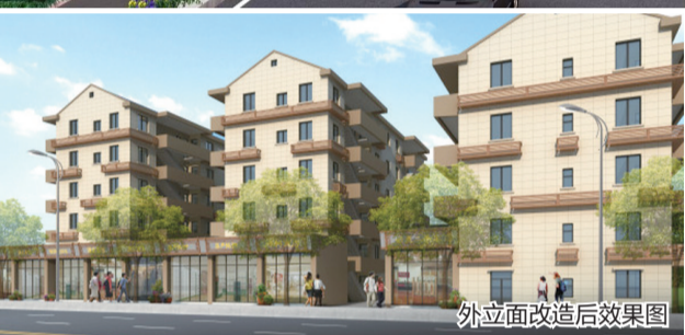
外立面改造后效果图