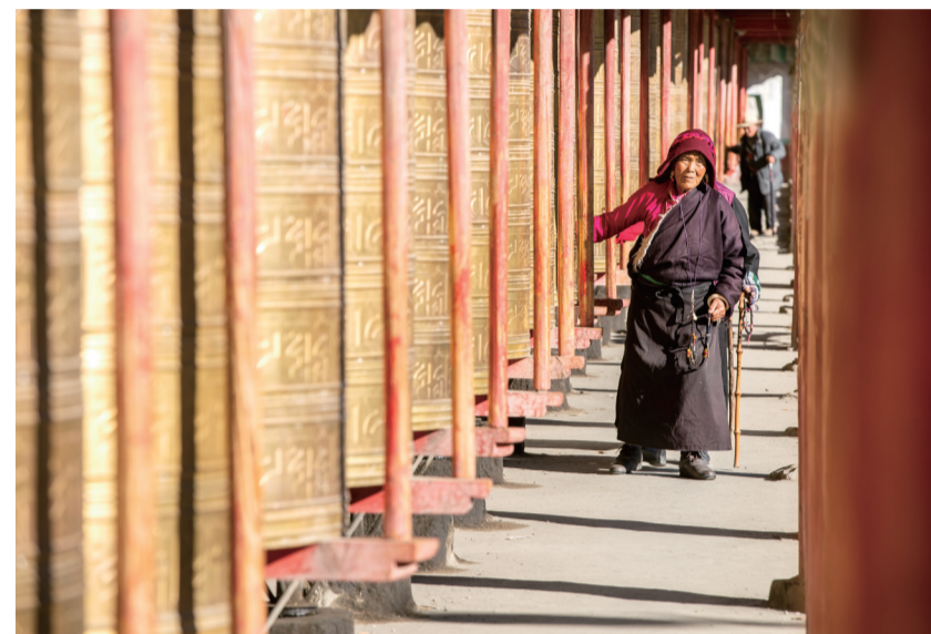
虔诚的藏民在转经轮