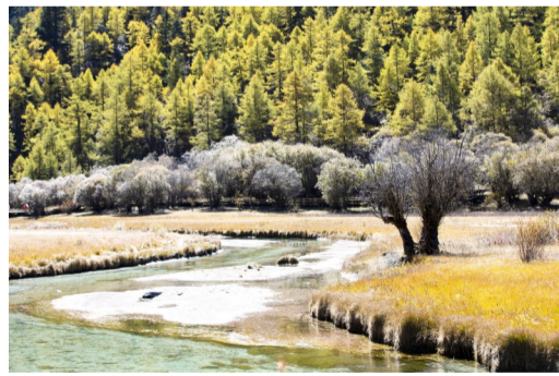
美丽的湖泊和树木