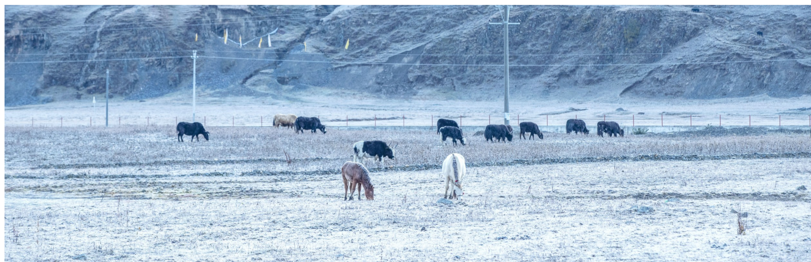
清晨草原上的骏马和牦牛