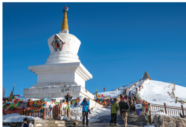
康巴第一关 之称的折多山