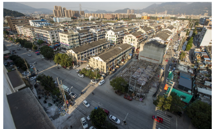
驮山5个村搬迁到104国道两侧的官山垟

据介绍，驮山现有各类生产型企业、个体工商户105家，其中鞋厂53家、鞋料加工厂41家，规模以上企业2家。2017年，驮山企业年销售收入约2亿元，年缴税约1800万元。