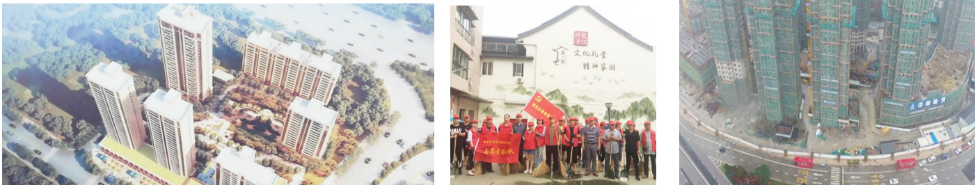
▲胜利(二号)区块项目效果图