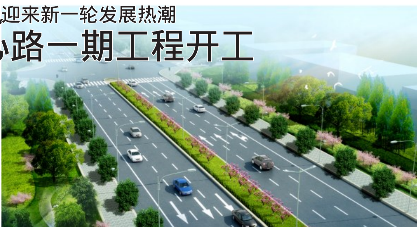
中心路一期工程项目效果图