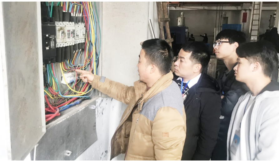
检查企业复工复产安全情况

每到一处,检查人员都仔细排查,要求企业务必认清当前安全生产严峻形势,夯实安全生产基础,强化自身安全主体责任,签订《安全生产责任书》。进一步完善安全管理制度,切实加强安全生产现场管理,积极开展企业隐患排查自报,并以员工为中心,加强对其进行安全教育和培训,保证员工具备必要的