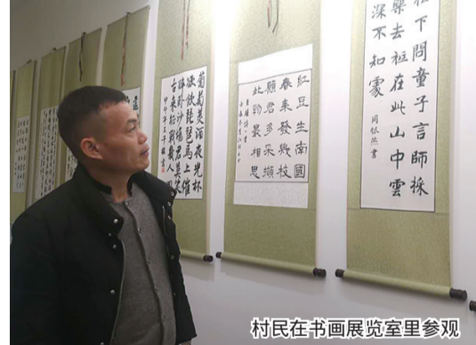
村民在书画展览室里参观