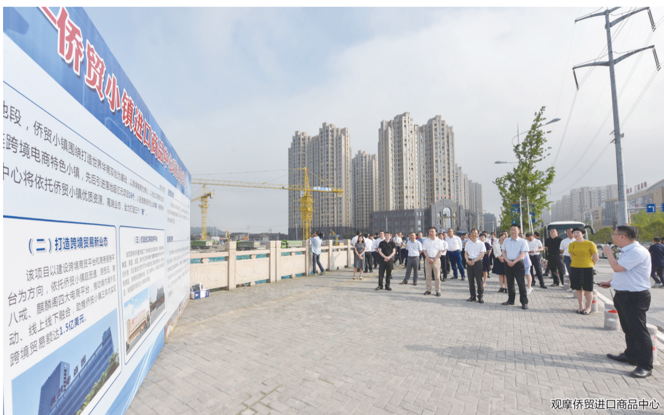
观摩侨贸进口商品中心

从塘下新区的浙江铭博新能源汽车部件智能制造项目到滨海新区的东新科创中心,再到经济开发区的瑞明汽车轻量化关键零部件智能化生产线建设项目,从江南新区的侨贸进口商品中心到安阳中心城区的城西康养中心,这场现场观摩活动犹如“行走的考场”,各地全力比拼重大项目,让参加观摩活动的市领导以及各部门、乡镇街、功能区有关负责人,见证了瑞安各地正在上演的转型发展“速度与激情”的较量。