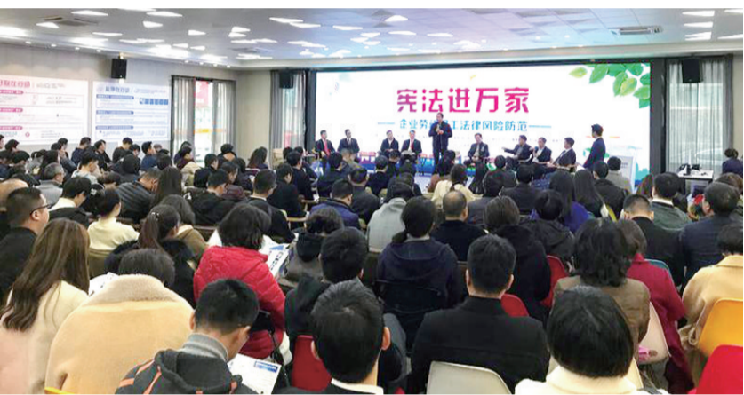
企业劳动用工法律风险防范讲座

近日,记者相继走访公检法司四部门,了解我市政法部门如何用一系列让民营企业家暖心的举措,保障民营经济实现高质量发展。