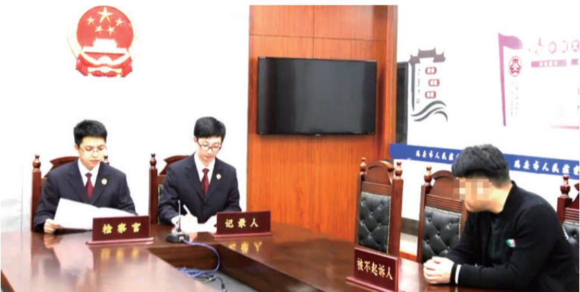
黄某逃税案的不予起诉宣告