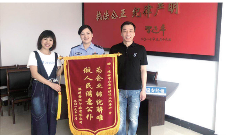
企业给公安民警送来锦旗