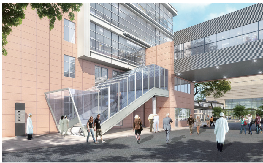
人行天桥初步效果图(最终以部门审批为准)

本报讯(记者 潘虹)好消息来了,记者从安阳中心城区开发建设中心获悉,经实地踏勘和研究,决定在市人民医院(万松院区)前建设人行天桥,项目分两期建设,6月18日先进行一期桩基础部分施工。