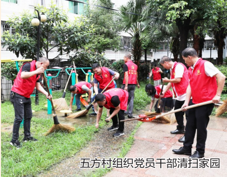
五方村组织党员干部清扫家园