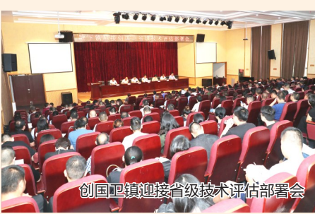
创国卫镇迎接省级技术评估部署会

城乡因美景而熠熠生辉,百姓因宜居而怡然自得。如今,卫生乡镇创建带来的民生福利正在越来越多人的心里形成一种新的乡村记忆,村民们不仅收获了碧水绿地、舒适生活,更收获了现代的生活理念、良好的卫生习惯和文明的生活方式。