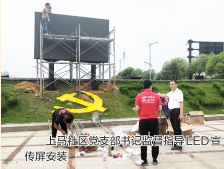
上马社区党支部书记监督指导LED宣传屏安装