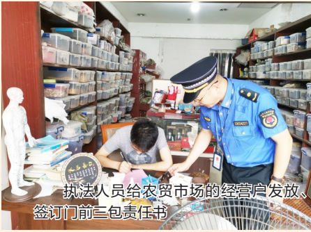
执法人员给农贸市场的经营户发放、签订门前三包责任书