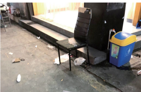
7月31日晚上,市区虹桥南路人行道上,有人乱扔餐饮垃圾。