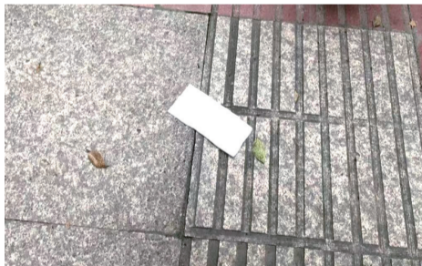
8月7日下午,市区沿江东路142号前人行道上,有人乱扔纸巾。