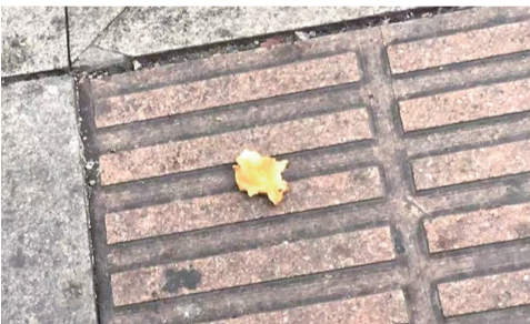
8月7日下午,市区虹桥北路人行道上,有人乱扔果核。