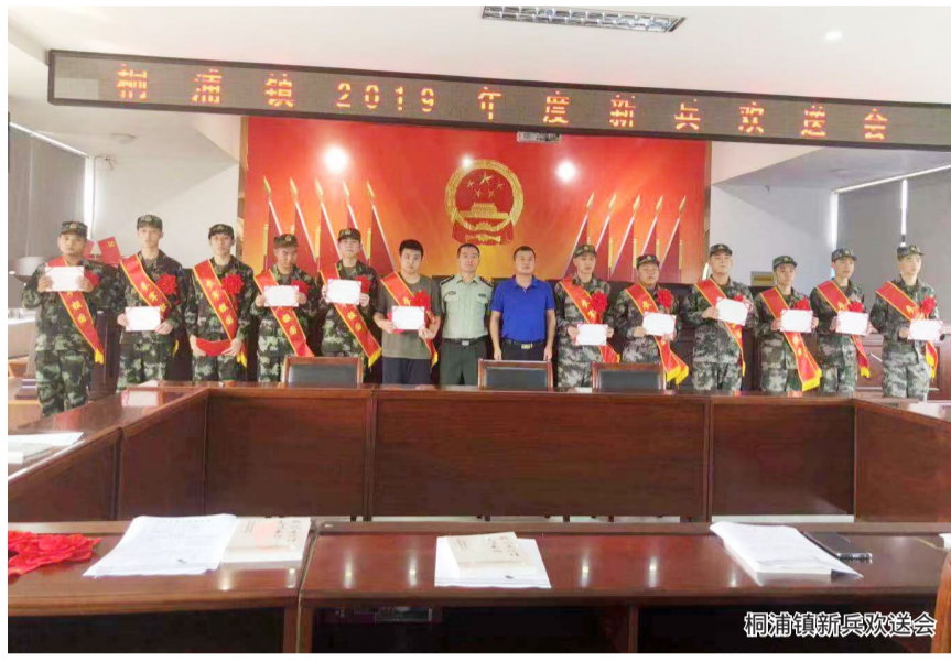
桐浦镇新兵欢送会

截至9月17日,该镇12名新兵(其中2名大学毕业生)全部踏入军营,在部队大熔炉中接受锤炼。