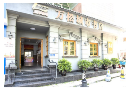
万松城市书房(已关闭)