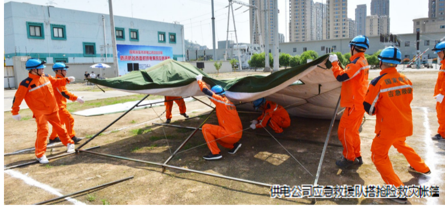
供电公司应急救援队搭建救灾帐篷

此次应急演练充分考虑了瑞安的气候环境和电网的运行情况,选择在220千伏飞云实训基地,模拟受台风影响,我市多处发生水淹,部分地势低洼地区变电站和配网设备受淹。电力部门迅速启动《防汛应急预案》和《台风灾害处置应急预案》,成立防汛抗台应急指挥部,开展应急处置工作。同时,220千伏东新变、瑞光变失电,飞云变和塘园变部分失电,引发我市失去41%的负荷,发生大面积停电事件。事件发生后,电网设备故障、重要用户保电、社会舆情等衍生事件相继发生,电力部门迅速启动《大面积停电事件应急预案》,开展应急处置工作。在指挥部的统一组织指挥下,电力各部门、班组通力