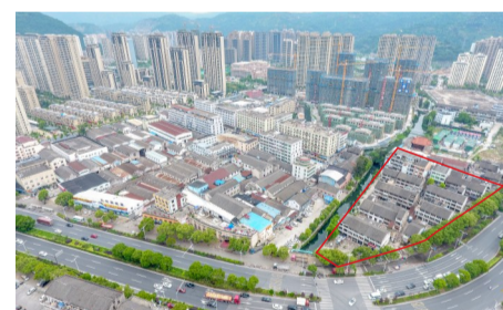
瑞祥大道边三角地块旧民房拆前

近日,仙桥社区瑞祥大道边三角地块53间旧民房 清零,拆除面积4000多平方米,拆空地计划用来建设公园,打造群众共享的绿色空间,以环境绿化