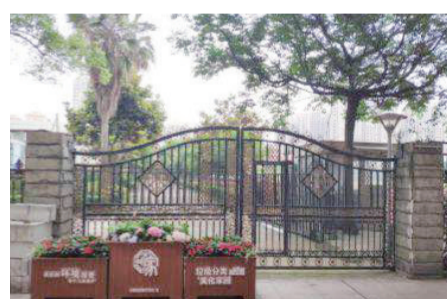
小区出入口环境整治后

目前,红色管家 团队在微网格群准确收集意见和建议,结合多数居民提出的美化居住环境的需求以及治安问题,计划将小区由 开 改为 封,并安装摄像头,请