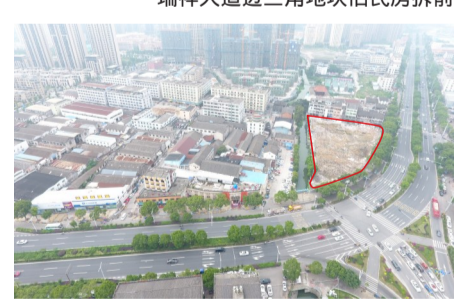
瑞祥大道边三角地块旧民房拆后