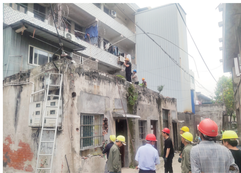
红星铁皮市场周边违章拆除现场

本报讯(记者 苏梦璐)日前,在安阳街道仙桥社区(原红星村)拆违现场,随着挖掘机摇臂上下摆动,红星铁皮市场周边违章建筑和已腾空的旧民房应声倒下,环境 痼疾顽症 得到根除。