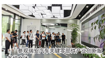
参观瑞安汽车关键零部件产业创新服务综合体

我市是中国重要的汽车零部件生产基地,产业总规模超500亿元,共有生产企业1800多家,其中规模以上企业300多家,产品涵盖12大类5000多个系列品种,制动系统、发动机关键铝部件、化油器等产品做到国内细分行业第一,座椅、滤清器、同步器等产品做到国内前三,设有国家级汽车电子零部件产品质检中心,拥有“中国汽摩配之都”“中国