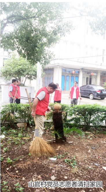
山官村党员志愿者清扫家园

本报讯(记者 陈异俗 通讯员 岑剑文 特约记者 徐洪梅/图)今年是中国共产党成立99周年。连日来,塘下镇党委引领全体党员,在塘下这片红色热土上追寻革命足迹、慰问建国前入党老同志、开展红色服务活动等,献礼“七一”建党日。