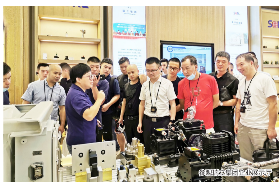
参观瑞立集团企业展示厅

6月30日,由温州市经信局、交通运输局、交运集团主办,瑞安市经信局承办的新能源汽车及零部件产业协同发展暨智能装备(首台套)产品推介会在我市拉开帷幕。来自主办单位的相关负责人,温州各县(市、区)经信局、交通局、公交集团、城乡客运公司、出租车企业以及温州市新能源汽车及零部件重点企业代表100多人参加推介会。