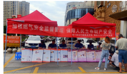
宣传燃气安全知识

近期,该局根据《城镇燃气管理条例》《浙江省燃气管理条例》,对全市燃气行业开展新一轮地毯式排查,同时聘请燃气行