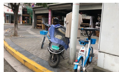
6月21日,玉海街道邮电北路,市民在公共区域拉绳挂晒衣服。