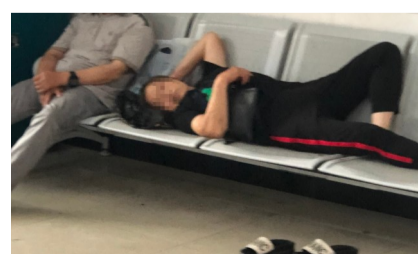
6月14日,陶山镇卫生院门诊收费处,市民公共场合脱鞋占位睡觉。