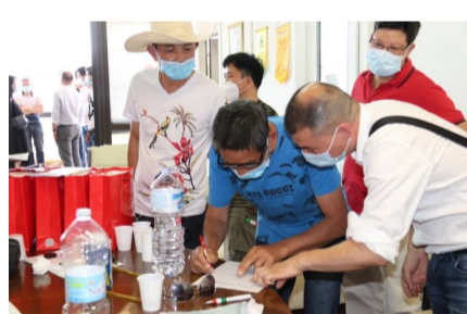
受灾瑞籍侨胞领取救助金

同时,中国驻佛罗伦萨总领馆向辖区内各侨团发出紧急呼吁,希望华人社区伸出援手。市委统战部积极响应,发动意大利侨团通过各种方式给予受灾侨胞支持和帮助。意大利中意青年联合会会员紧急采购米、面、蔬菜、鸡蛋、饮料等生活物资,及时缓解了受灾侨胞面临的基本生计问题。来自我市及佛罗伦萨各界的援助行为得到当地民众和侨胞的一致好评。