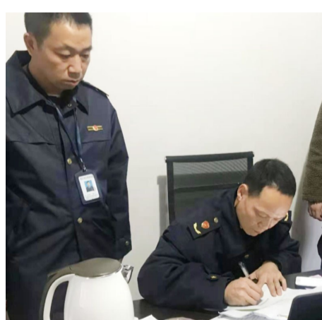
执法人员整理旧案资料

执法人员介绍,此次办结的一起便利店销售过期食品、无标签预包装食品案件,因便利店关闭、店主失联,过去该案一直悬而未解,在此次集中清理行动中,执法人员通过多渠道反复核查信息,得益于 大数据 信息完善,终于在新居民信息平台中找到该店主的最新信息,取得联系后办结该案。