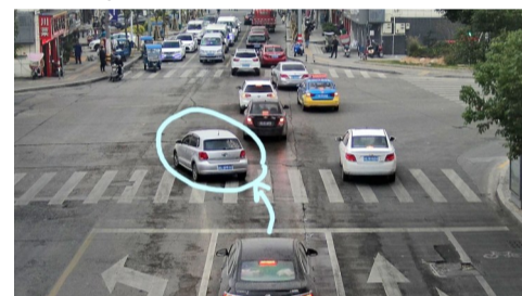
12月12日,瑞光大道安阳路口,车牌为浙C3PP71的机动车通过有灯控路口时,不按所需行驶方向驶入导向车道。