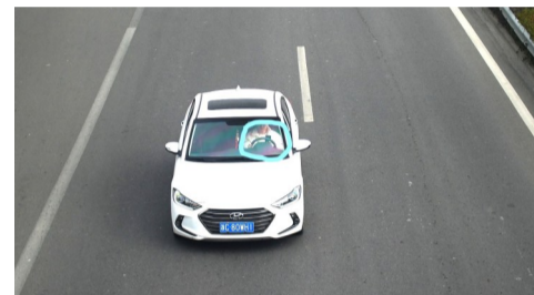
12月7日,104国道飞云江大桥(北)附近,车牌号为浙C80WH1的机动车驾驶员驾驶时手持使用移动电话。