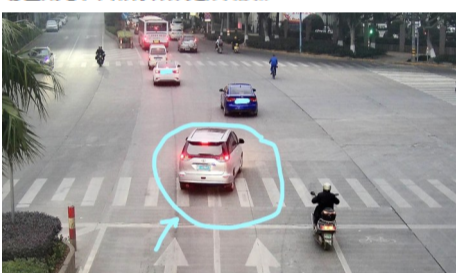
12月12日,罗阳大道与滨江大道交叉路口,车牌为浙C69N72的机动车通过有灯控路口时,不按所需行驶方向驶入导向车道。