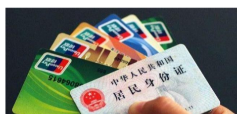
客户信息修改功能,选择证件有效期栏位,按提示进行更新。

近期,有市民发现自己的银行卡无法使用,连基础的存取款、转账汇款等业务都无法办理,后咨询到银行才发现是办理银行卡是录入的身份证信息已过期。