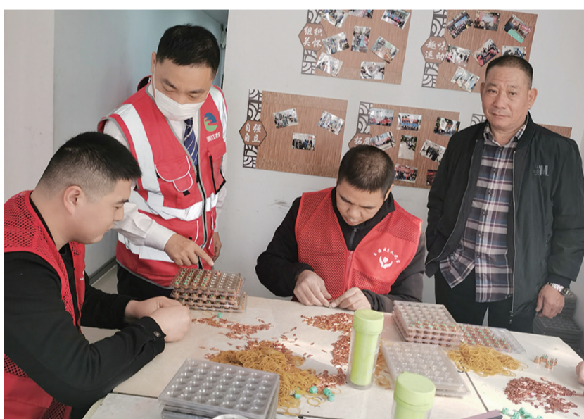
在残疾人之家手工制作现场慰问残疾人就业情况

为倡导助残扶残的良好风尚,进一步提高残疾人的幸福指数,推动残疾人事业的发展,在第二十九个国际助残日到来之际,瑞安农商银行玉海支行党支部联合瑞安市安达铁路设备配件厂党支部、玉海街道镇海门社区党支部对辖区内的玉海残疾人之家开展走访慰问活动。