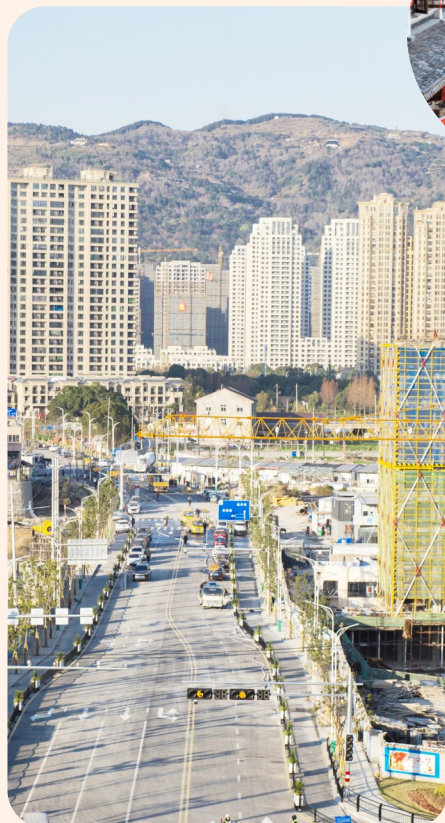
安阳路全线贯通