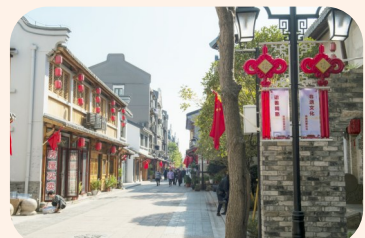
公园路历史文化街区