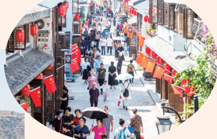
大沙堤开街