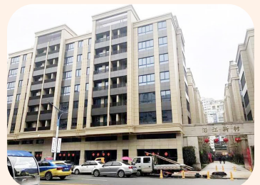
改造后的沿江新村