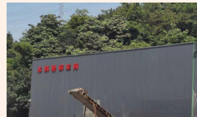
垃圾分拣厂木料粉碎车间