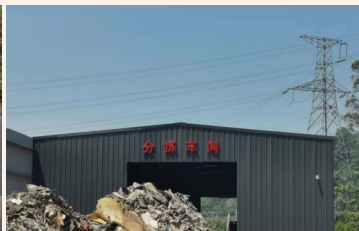
垃圾分拣厂分拣车间