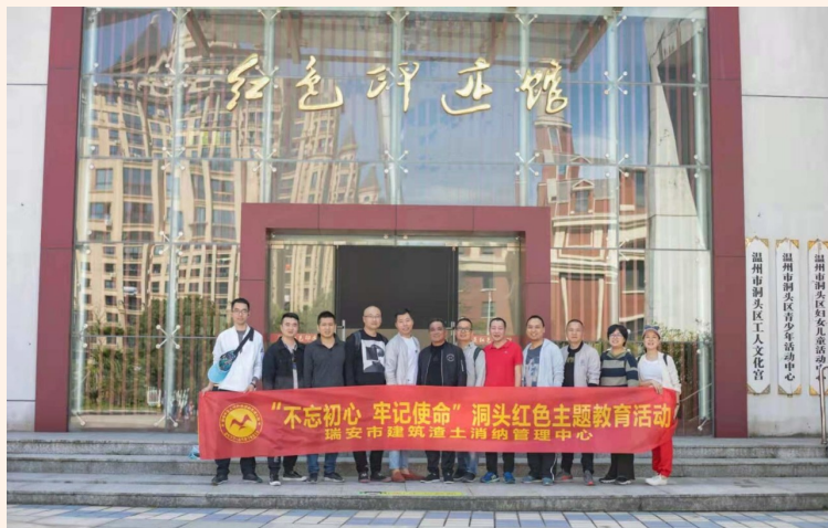
开展红色主题教育活动

智能化管理加上严格的考核,今年我市渣土车抛撒滴漏、偷倒乱倒、超速超载、疲劳驾驶等顽疾已有效减少。今年上半年查获的违章数同比下降约30%。蔡甫化说,下一步,我市将对在建工地和运输企业加强建筑渣土运输管理相关法律法规宣传力度,积极引导施工单位强化责任意识,督促车辆驾驶员在运输过程中自觉遵守各项规章制度,进一步推动渣土泥浆运输行业的健康平稳发展。