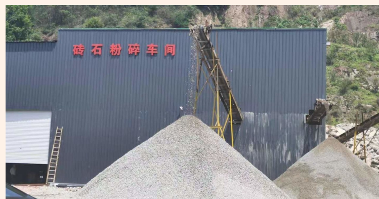
垃圾分拣厂砖石粉碎车间