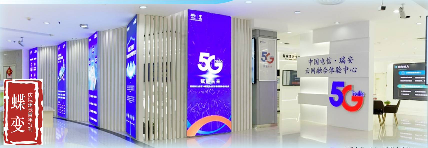
中国电信·瑞安云网融合体验中心