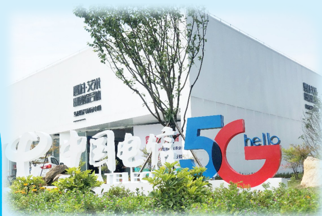
曹村艾米5G生态智能农业示范基地

立足新起点、迈入新征程。中国电信瑞安分公司将深入学习贯彻习近平总书记重要指示批示精神,在瑞安市委市政府和上级公司正确领导下,传承红色电信基因,切实发挥自身云化改革和数字化转型核心优势,做网络强国的“践行者”、数字瑞安的“主力军”、网信安全的“国家队”,全面赋能瑞安数字化改革,努力在我市全力打造“全省县级城市数字化改革标杆”,在高水平建设“青春都市·幸福瑞安”进程中展现更大担当,作出更大贡献。