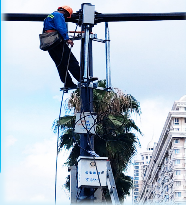
新建市公安局“雪亮工程”