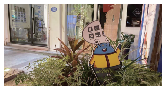
7月24日,公园路历史街区,公益宣传牌破损。

小广告乱贴、不文明遛狗。为贯彻落实《温州市文明行为促进条例》,进一步强化城市管理,提升城市文明形象,营造人人讲文明、处处见文明的浓厚氛围,不文明曝光台继续对全市范围内的不文明行为予以公开曝光。本期曝光主题:影响环境的不文明行为。(记者 潘虹)