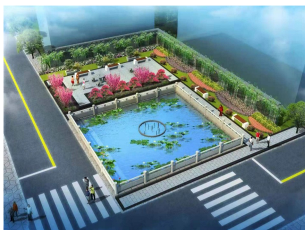
大树埭荷花池效果图

这里是第一双塑革鞋的诞生地,这里是“中国胶鞋名城”的主要生产基地,这里的村民,每3个人中就有1位是老板。请跟随记者的步伐,看仙降村共同富裕何以先行的秘诀。