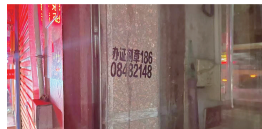
7月24日,万松西路,小广告乱印。