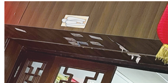
7月24日,万松西路,小广告贴到店铺门框上。