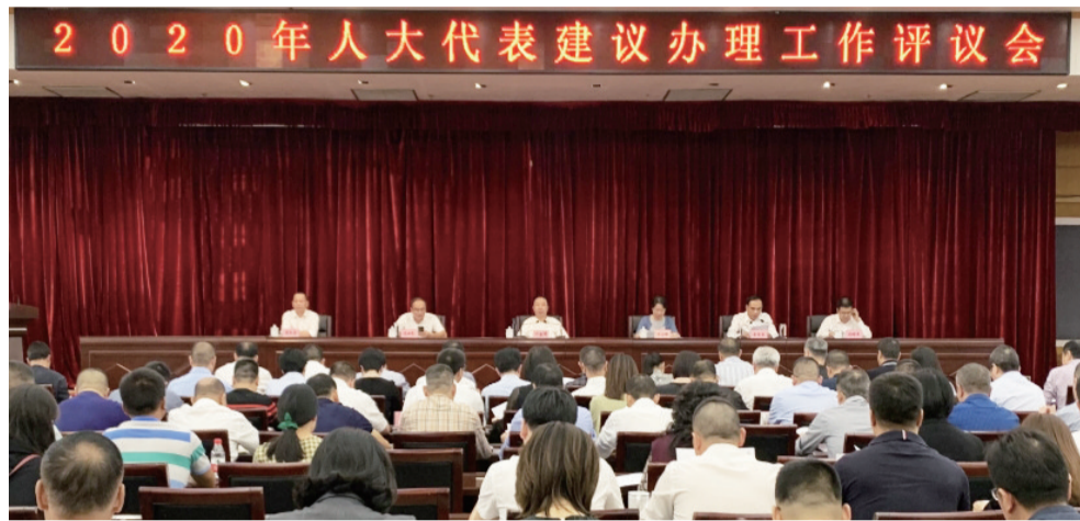
2020年人大代表建议办理工作评议会

5年来,市人大常委会还持续推动小微园建设、乡村振兴示范带建设、学校体育设施向社会开放、养老服务体系建设、交通出行等代表建议重点件落实,为面上建议办理工作树立标杆、作出示范。