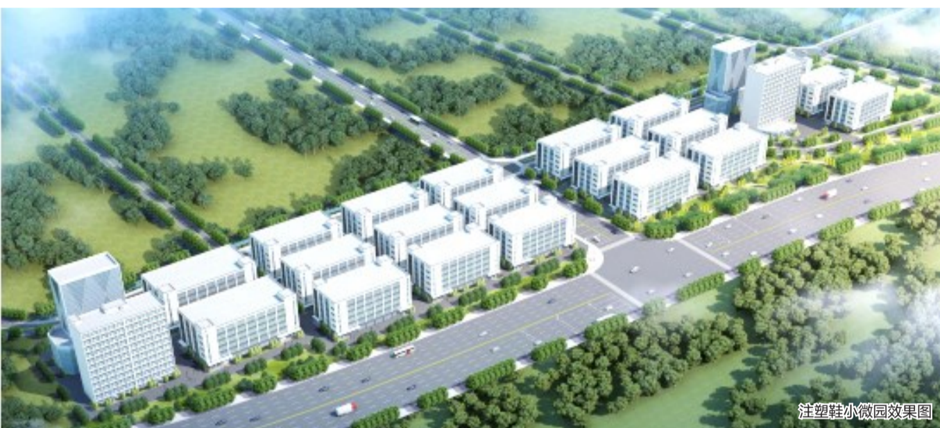
注塑鞋小微园效果图

近30年来,因为各种原因,该产业一直存在不规范、高能耗、低产出等问题。2021年,我市以数字化改革为导向,坚持治理和扶持并驾齐驱,引导休闲时尚注塑鞋行业全产业链有序发展,重构新格局、重塑新形象。今年计划培育规上企业达30家,增量超10倍,3年内规上企业规模可超100家,规上产值规模有望突破50亿元。