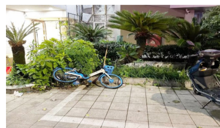
8月21日,万松路(工行附近),共享单车“闯入”绿化带,破坏绿化,影响市容市貌。