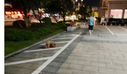
8月21日,万松东路(安阳大厦附近),市民遛狗不拴狗绳。