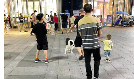
8月21日,吾悦广场外,市民遛狗不拴狗绳。