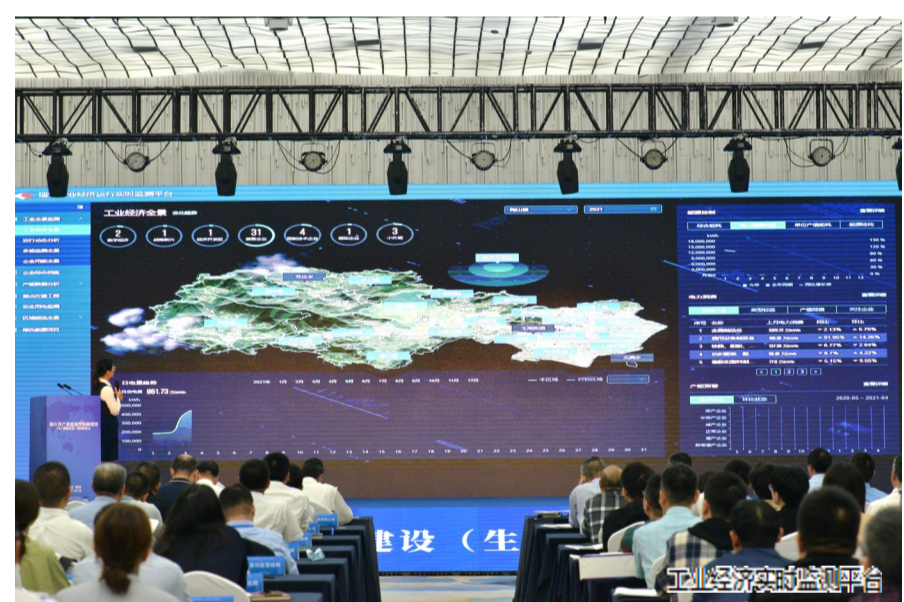
工业经济实时监测平台

构建现代化产业新体系没有捷径,只有征程。未来,我市将继续以奋斗者的姿态,激情干事,勇争一流,担负起高质量发展的重任,以更高的产业层次,构建起支撑高质量发展的现代化产业体系。