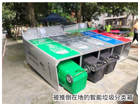
被推倒在地的智能垃圾分类箱

据飞云街道垃圾分类工作相关负责人介绍,为实现辖区垃圾分类全覆盖,该街道今年采购了一批智能垃圾分类箱并投入使