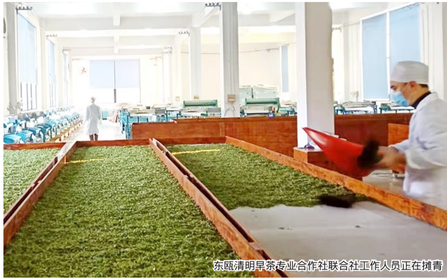
东瓯清明早茶专业合作社联合社工作人员正在摊青

本报讯(记者 黄丽云)近日,我市下发2020年度农民专业合作社示范项目建设补助资金,9家农民专业合作社共获得补助近400万元。