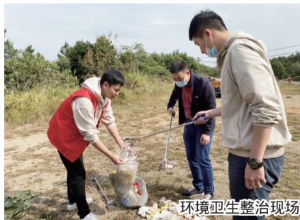
环境卫生整治现场

后通知环卫部门统一将其运走。此外,大型的建筑垃圾也需要环卫部门统一清理。锦湖街道办事处相关负责人表示,下一步,街道将对集云山实行日常保洁与监管,保护山水资源,还净于山、还净于山。