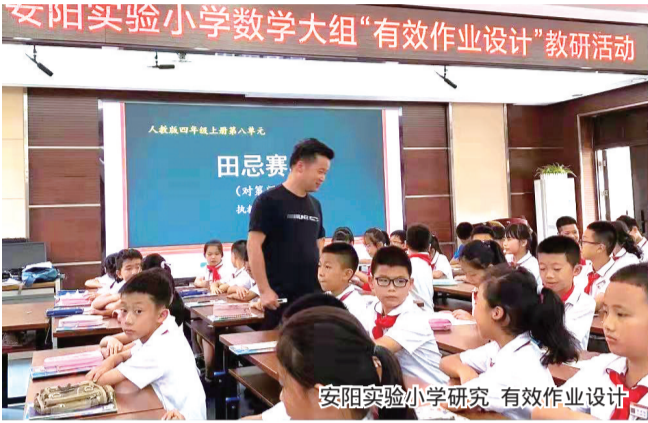
安阳实验小学研究有效作业设计