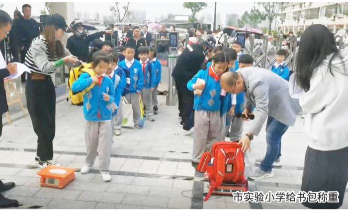
市实验小学给书包称重