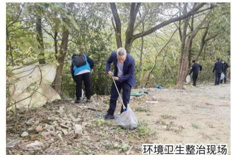
环境卫生整治现场