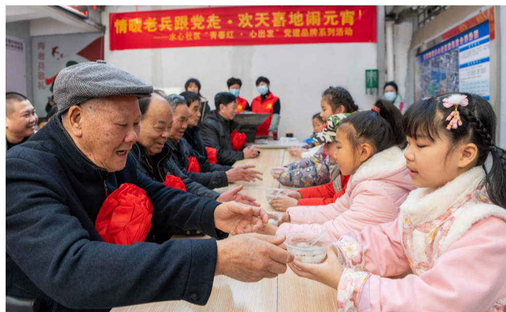
昨日,玉海街道水心社区举行“情暖老兵跟党走·欢天喜地闹元宵”活动,小朋友们为该社区13位老兵送上自己做的汤圆,市摄影家协会志愿者为老兵拍摄集体照、全家福。(记者 孙潇)