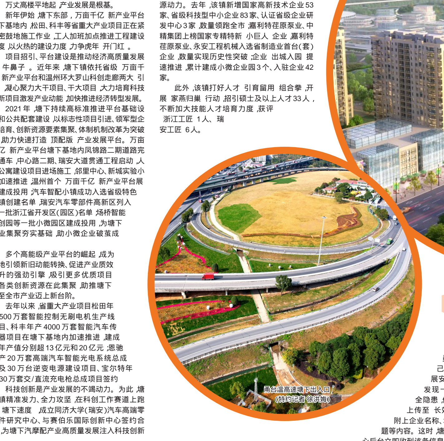
万亩千亿 新产业平台效果图

近年来,塘下镇锚定温州大都市区主中心南部新区 排头兵 建设目标,坚持 一张蓝图绘到底,以大手笔铺开大建设,构建 一心两轴三城 的城市发展新格局。尤其是 2021 年,塘下大动作不断,一幅日新月异的城市发展新画卷正在这片充满希望与梦想的热土上展开。完成塘河新城全域规划