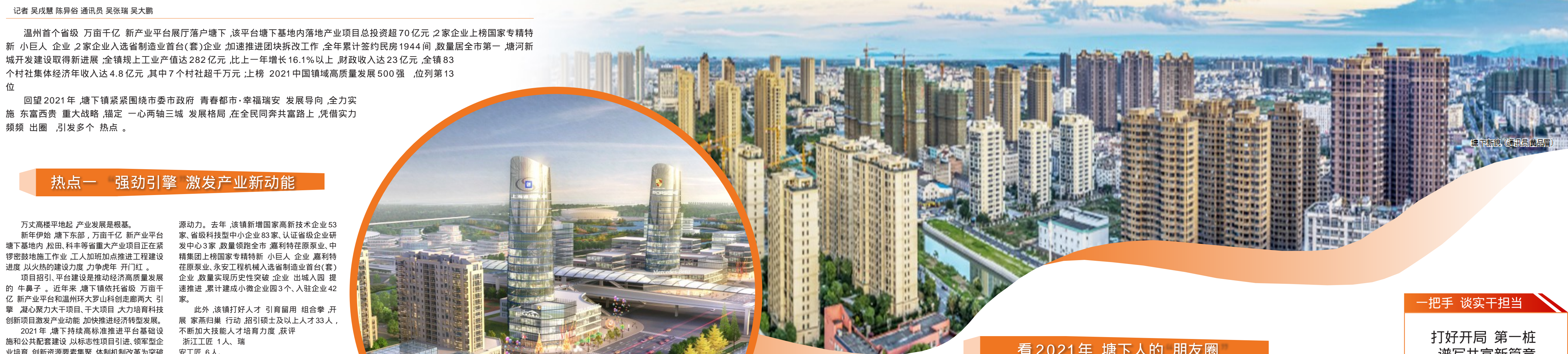
塘下新城 (通讯员黄品甫)