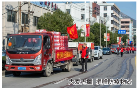
大爱无疆 捐赠防疫物资