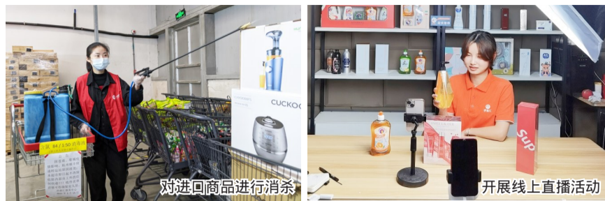
对进口商品进行消杀

近期,全国多地出现境外邮件核酸检测呈阳性的消息。近日,记者走进我市部分涉进口物品的超市、企业,看看其如何加强疫情防控。