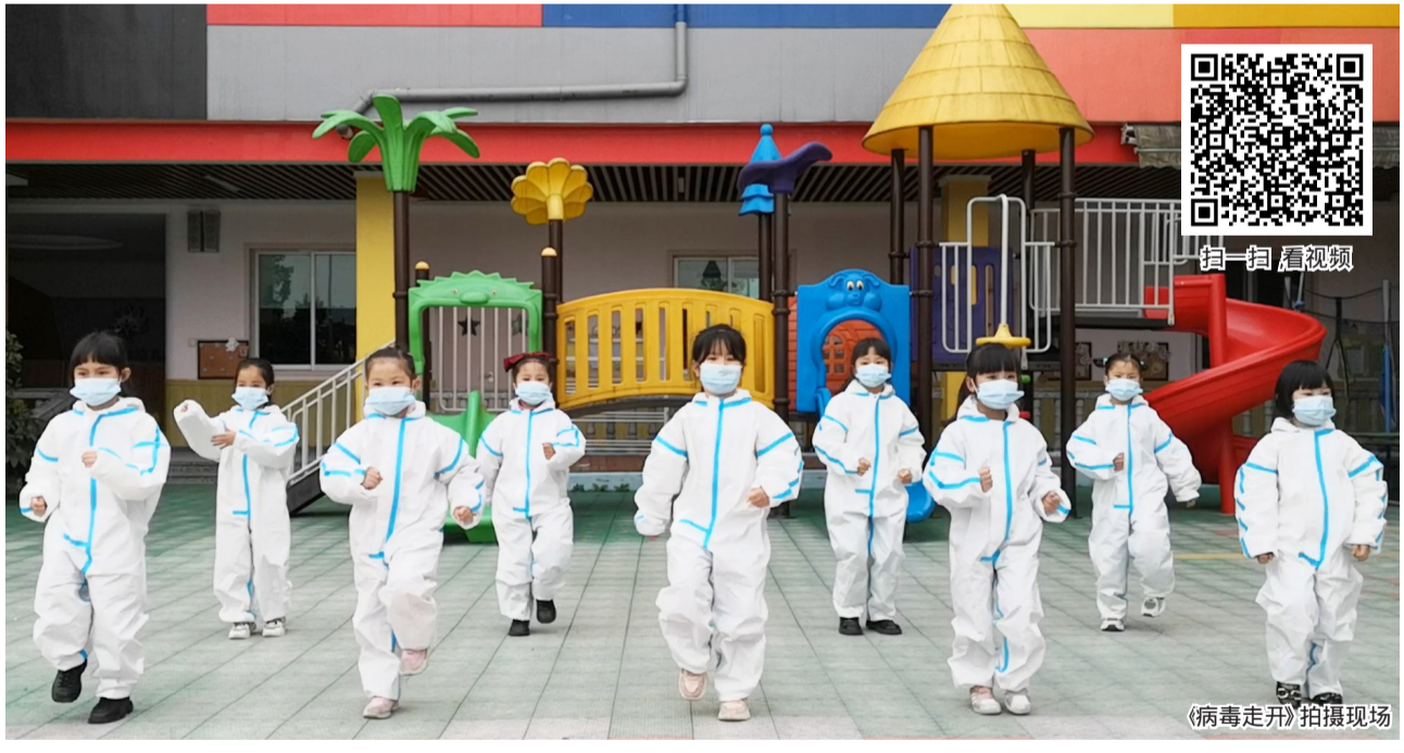
《病毒走开》拍摄现场

本报讯(记者 林瑞蓉)病毒走开,快点走开!日前,马屿镇童社中心幼儿园拍摄的防疫宣传小视频《病毒走开》在多个社交媒体广泛传播。视频中,9名幼儿园大班小朋友佩戴口罩、身穿迷你防护服,在音乐声中舞蹈。认真又稚嫩的动作,让人看得萌心四溢。