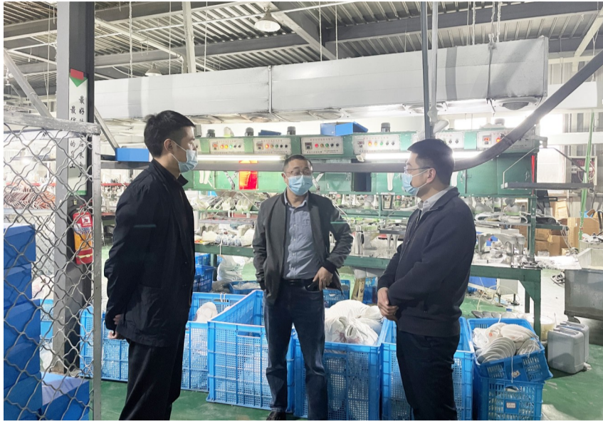
2长+2员 日常走访企业

近年来,基层网格化管理让群众看得见、看得懂,谁是分包责任人一清二楚,受到了群众的一致好评。仙降街道在享受到基层网格管理的甜头后,今年创新推行经济网格化管理,将辖区按经济密度、市场主体数量、规模及产业类型合理划分为24个经济网格,以2长+2员形式开展经济网格化工作,助力经济发展提质增效。 今年第一季度,街道主要经济指标综合排名位居全市前列,实现开门红。