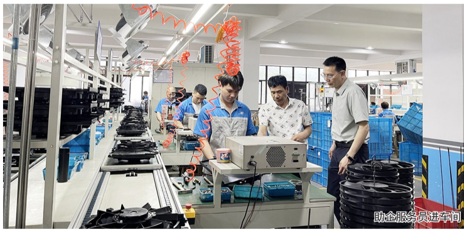
助企服务员进车间