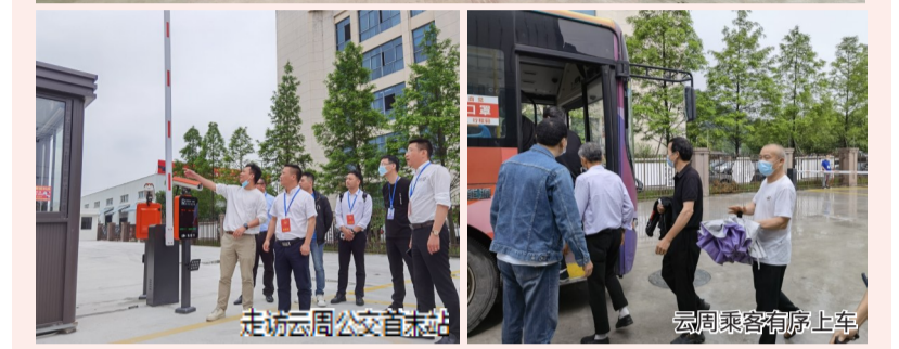
走访云周公交首末站