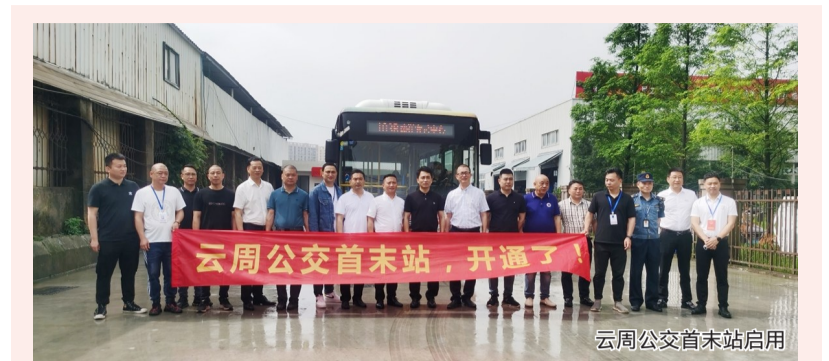
云周公交首末站启用

说，从当下来看，办事处周边有站西和黄垟两个社区，因为没有公共交通途经此处，4000多常住人口出行不便，从长远看，附近的工业园区启用后预计新增2万多名务工人员也将面临出行问题。更重要的是，该街道区域位置呈狭长型，办事处所在地位于辖区最南端，作为街道的行政中心，公共交通不能直达，就像一座孤岛，给前来办事的群众造成不便。