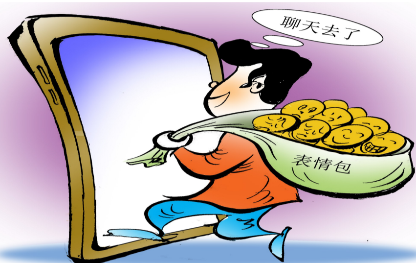
没有表情包，怎么愉快地聊天！这是发自网友的感叹。的确，有表情包的对话，成本低、效率高，一个表情包胜似千言万语。表情包能消弭文化、经济、年龄等因素造成的身份隔阂，也易于在趣缘群体之间形成文化认同。从复制日常喜怒哀乐，到捕捉、标记、生成时代和社会表情，表情包从情绪符号变成网络社交利器，作为文化现象几经迭代，发展成为一种媒介力量，影响着社会心理和人际交往。从表情符号的发明，到表情包的升级，都离不开媒介技术发展。未来，媒介的发展将建构出什么样的数字交往景观？这样看时，没有表情包，怎么愉快地聊天，又成了一个有待回答的疑问句，一个看似不成问题的问题。(蒋燕南画)