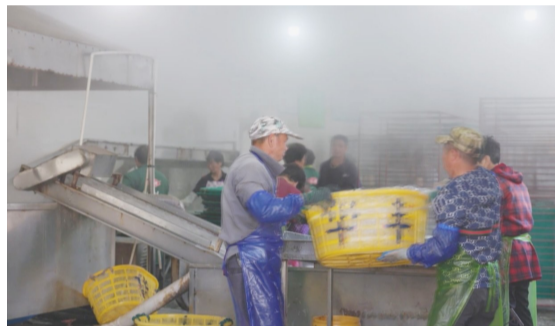
海货加工厂加工丁香鱼