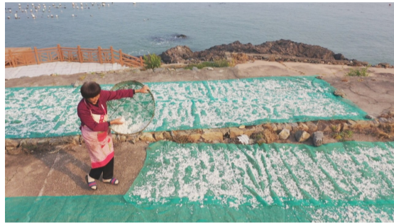
渔民古法晒制丁香鱼