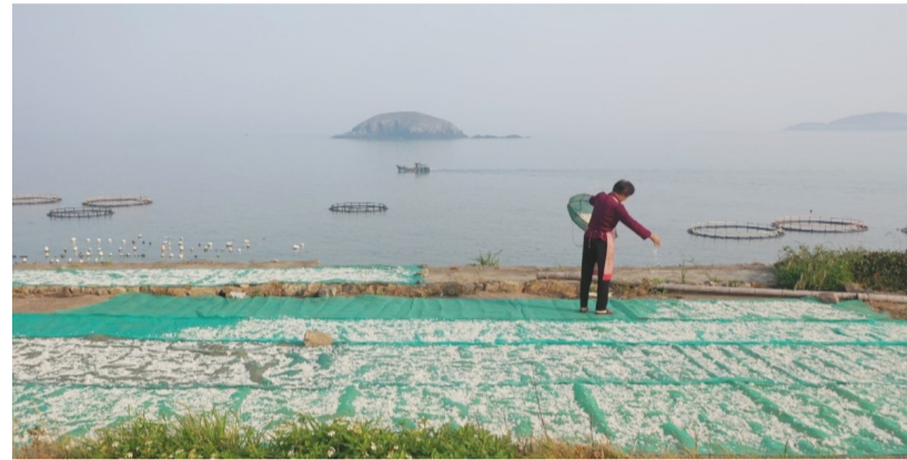
渔民古法晒制丁香鱼