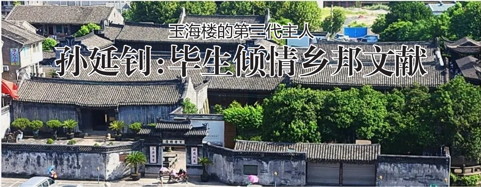
玉海楼的第三代主人