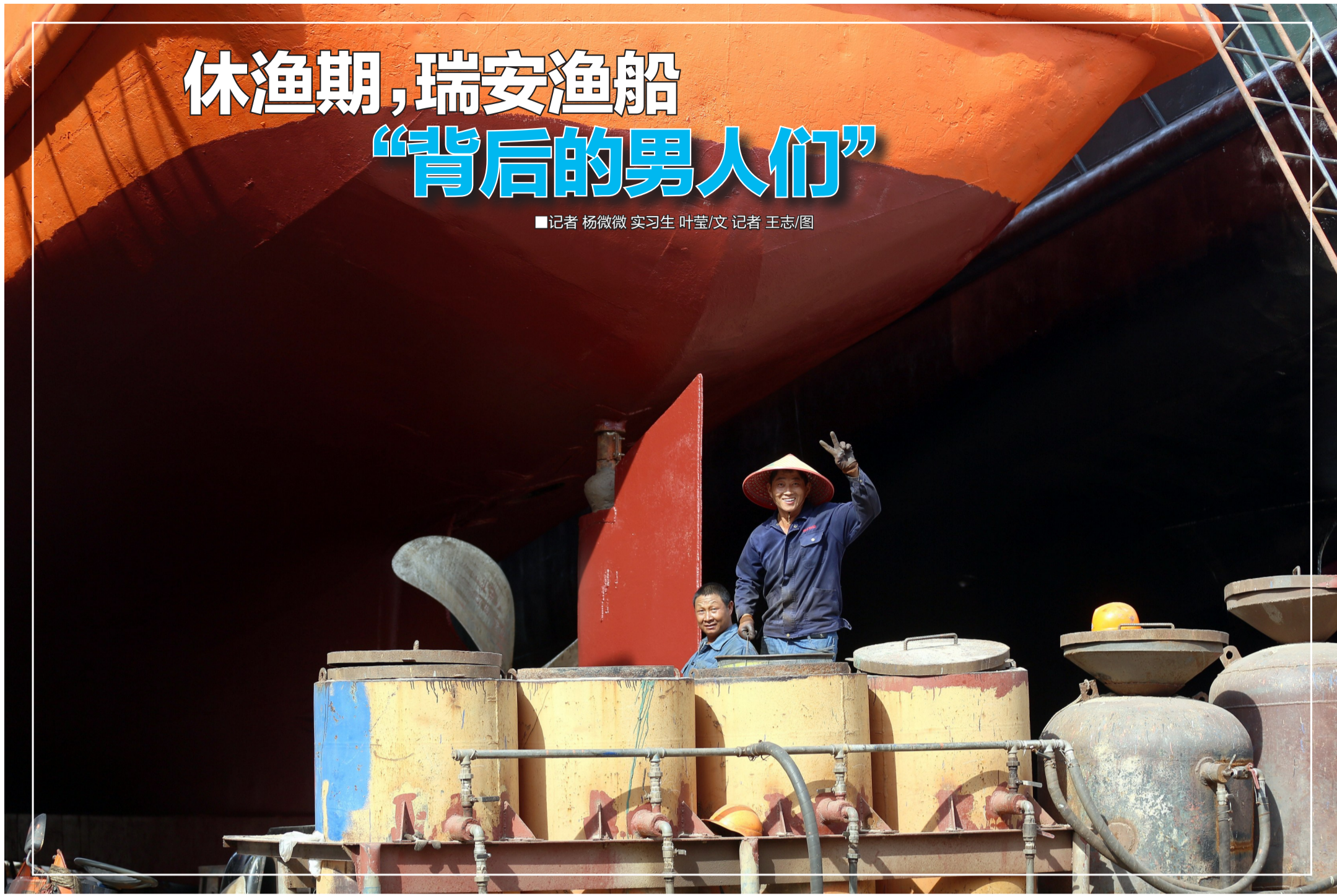
看到记者在拍照，他开心地比了一个“耶”