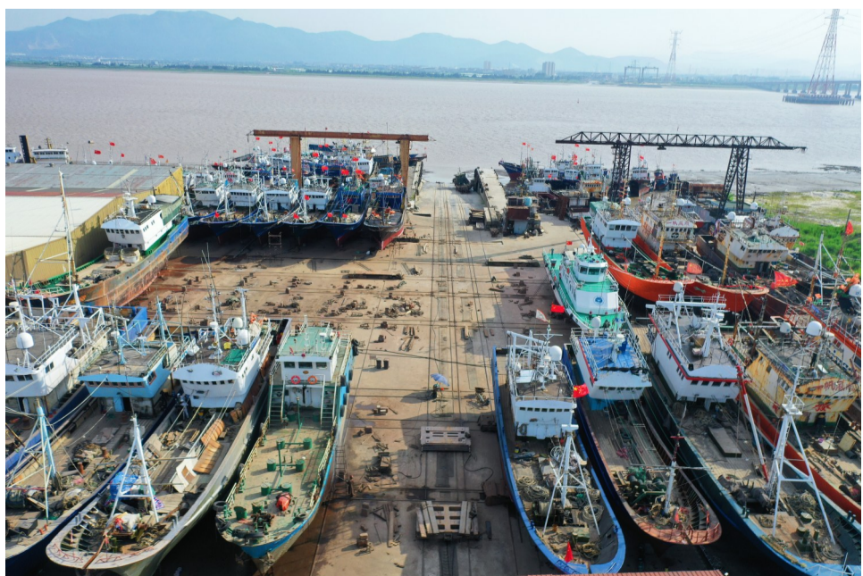
岸边停满了待检修的渔船