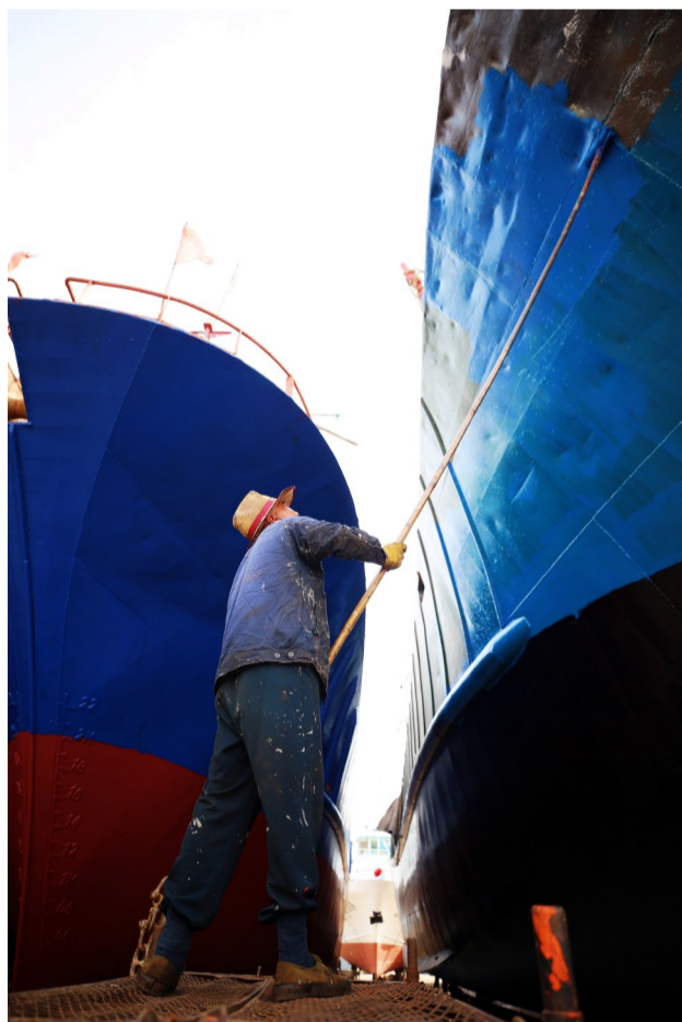
休渔期，船员也没有闲着，一艘渔船的维修保养，仅船体油漆就要先后刷四遍，一遍要刷3个小时才能完工

每到东海休渔季节，在海上长时间劳作的渔船都要上岸接受专业的保养，以应对下一轮开渔捕捞作业。