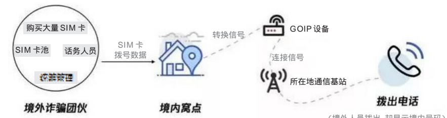
(境外人员拨出,却显示境内号码)