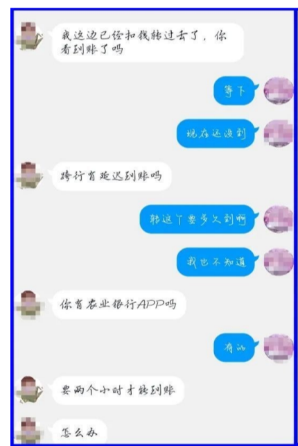
小郭与同学聊天截图

【警方提醒】市民不要轻信QQ、微信涉及的转账汇款信息,尤其是在网络社交软件中要求转账汇款的,应提高警惕。针对