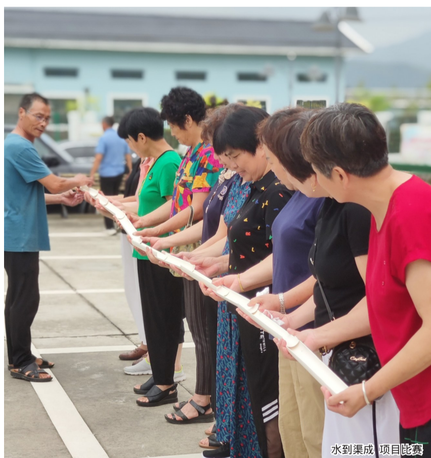
水到渠成项目比赛

本报讯(通讯员 刘慧洁 记者 林瑞蓉)8月28日上午,马屿镇马岩村举办关爱老人趣味健身运动会,让老人享受趣味运动带来的欢笑与畅快,让邻里感情在欢声笑语中升温。活动吸引80位60岁以上的老年人参与。