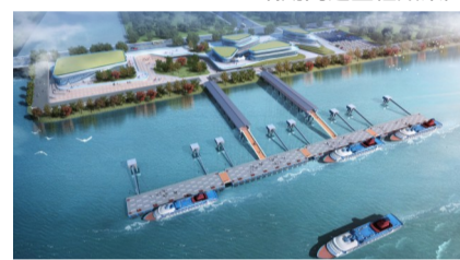
东山陆岛码头效果图