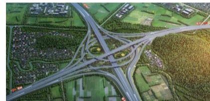
瑞湖高速工程效果图