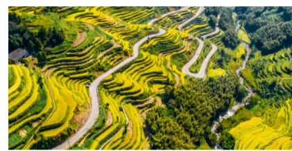
山村致富路

此外，去年，市交通运输局自我加压，在项目前期工作上猛力，瑞湖高速公路工程、322国道瑞安乙甲至岭脚段建设工程等项目用地预审批复速度刷新省内审批记录，全面推进温福高铁、温武吉铁路、甬台温高速改扩建、市域铁路S3线及附属配套工程（温瑞快速路）等29个、总投资约850亿元重大交通前期工作，数量为历年最多。