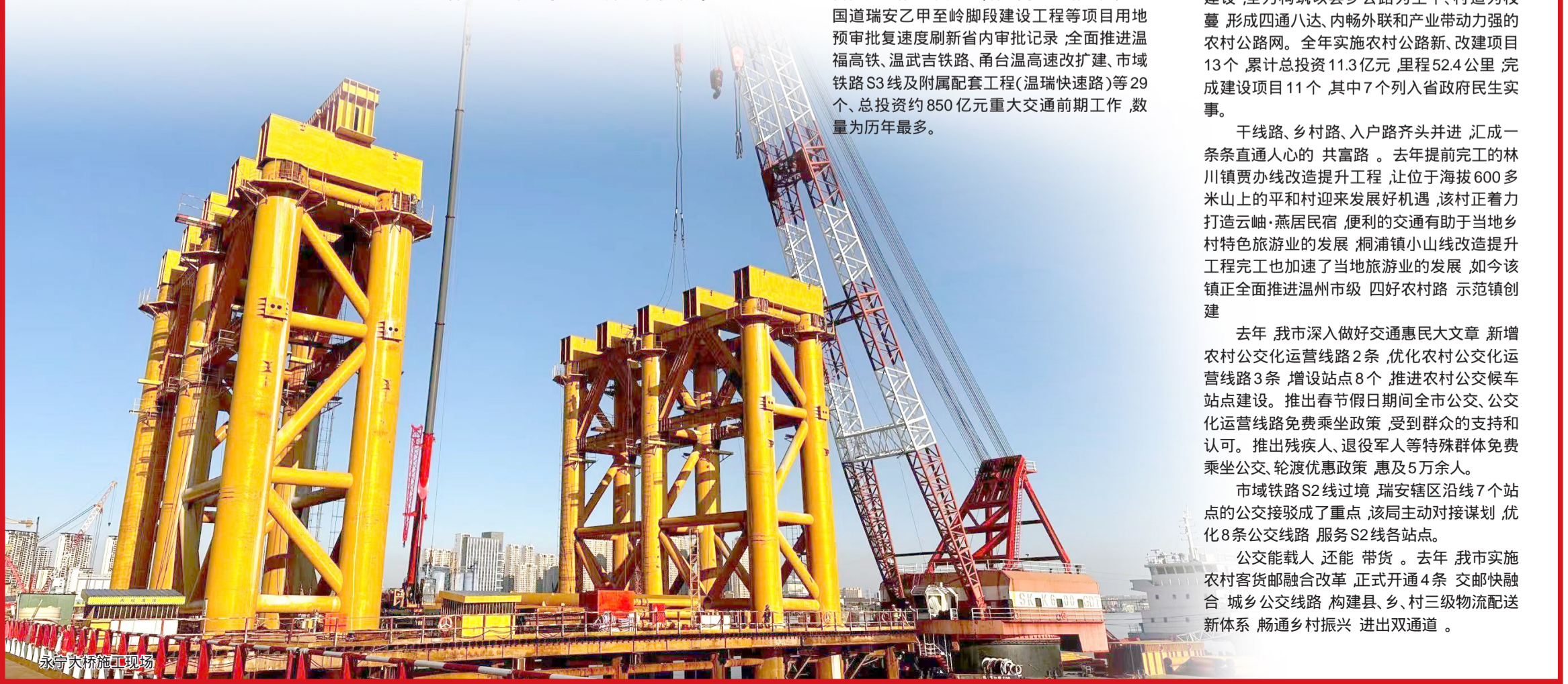
永宁大桥施工现场

公交能载人，还能带货。去年，我市实施农村客货邮融合改革，正式开通4条“交邮快融合”城乡公交线路，构建县、乡、村三级物流配送新体系，畅通乡村振兴“进出双通道”。