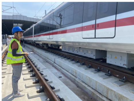
市域铁路S2线综合联调