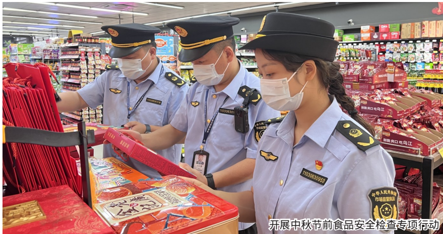
开展中秋节前食品安全专项检查专项行动