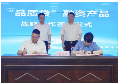
“品质贷”融资产品战略合作协议签约仪式

项，主导制订行业标准3项、浙江制造团体标准6.5项，2个项目申报省级标准化试点项目，1家单位通过温州市服务业标准化试点项目验收，成功发布温州首个地方技术性规范《乡镇（街道）社会工作站评价规范》，品牌战略摘得累累硕果，是市市场监管局一企一策对标精准服务，扎实推进千企创牌专项行动的成效。此外，该局还加大专利密集型产业培育力度，全年新授权发明专利379件，新增国家知识产权优势企业1家、省级知识产权示范企业10家，新增绿色产品认证证书2张，培育绿色认证企业13家。