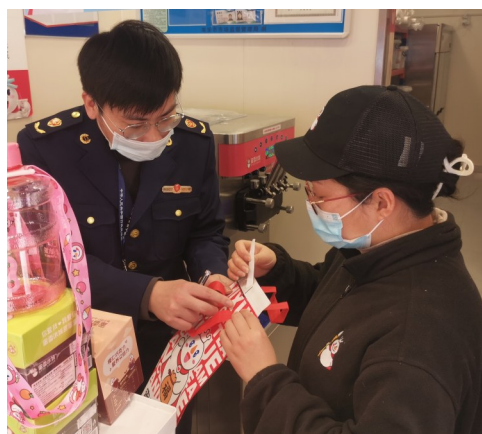
开展外卖封签专项检查