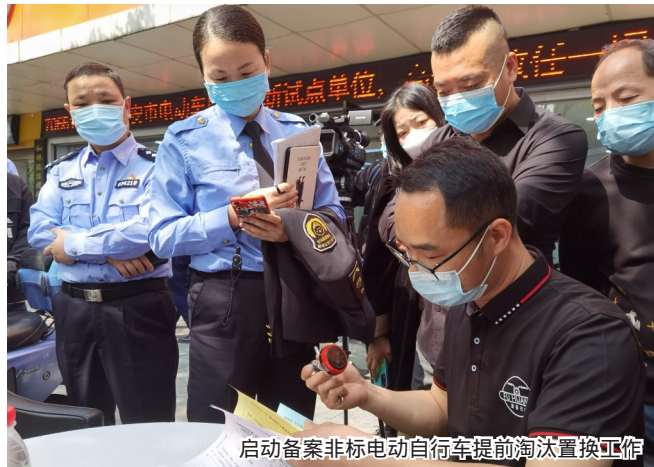
启动备案非标电动自行车提前淘汰置换工作

疫情下的2022年，时间有过保质期，空间有过封冻期，一切都是那么不确定，但总有一些充满力量的闪耀场景释放出满满的安全感，值得被定格。这些场景中，他们守正创新，严监管、优服务，护航高质量发展，他们务实担当，守底线、保安全，用心用情守护稳稳的民生幸福。他们是市监人。