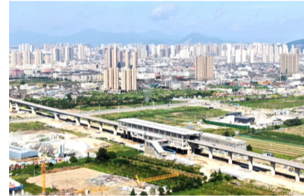
重点项目建设现场

在城镇品质提升工作中，该街道始终坚持高质量推进，以精细化实施总投资达2600万元的中、西部区块改造提升工程，积极响应市人大一号议案，纵深推进人居环境整治提升行动，累计整改销号“十乱”点位1.5万余处，美丽田园整治累计拆除各类乱搭乱建82处，清理垃圾160余吨。