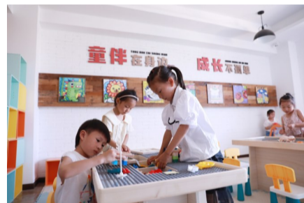
儿童在共富空间玩耍