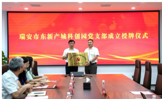
瑞安东新城科创园党支部成立