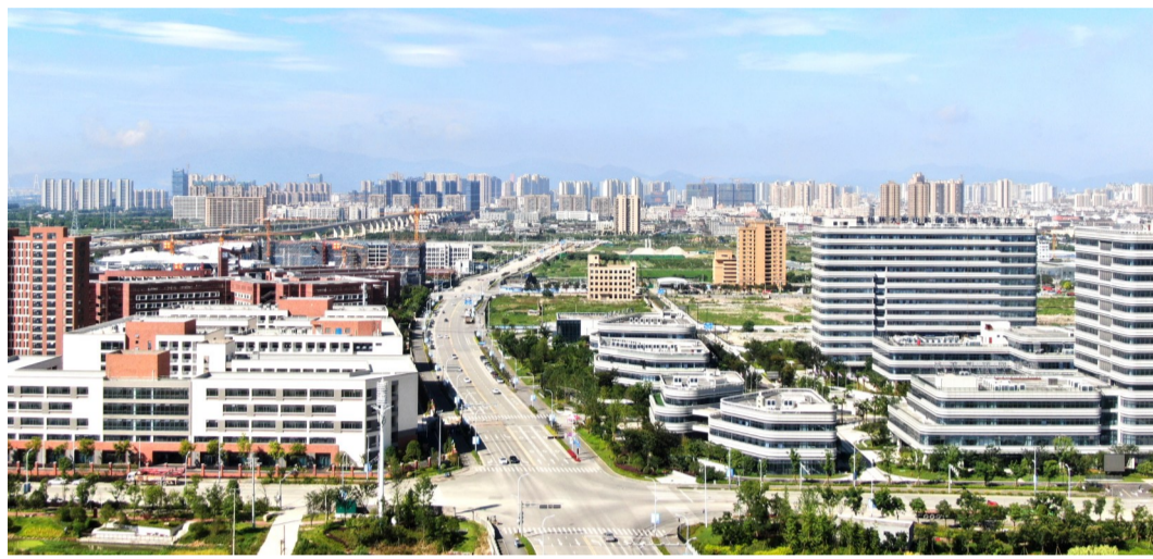
汀田城镇面貌

11月29日，温州市域铁路S2线汀田车辆段上盖一层平台建设工程顺利结项。据悉，该项目串联温州市域铁路S2线大典下站和汀田站，是温州市域铁路首个TOD上盖开发项目，建成通车后，将助推汀田加快融入温州城区与瑞安城区半小时交通圈，对当地经济发展具有重要意义。