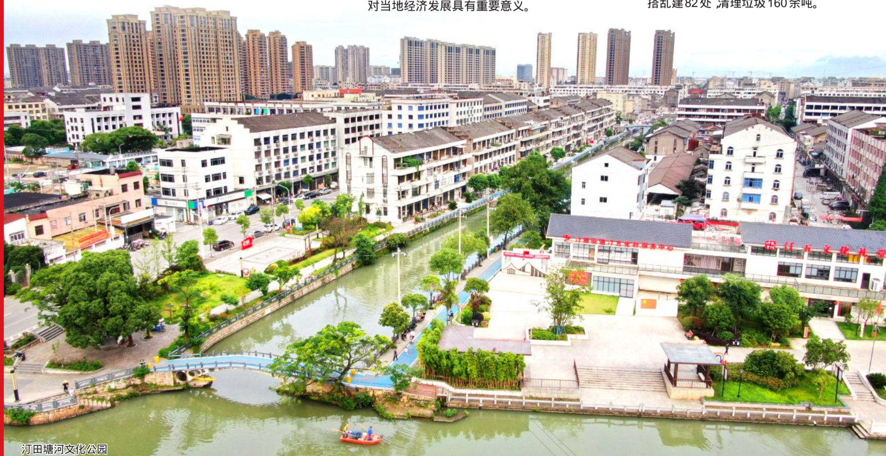
汀田塘河文化公园

同时，该街道聚焦“共享社·幸福里”建设，打造集教育、服务、休闲于一体的党群服务中心，汀五村获评温州市引领型五星级标杆农村，成立科创园党支部，组建1+3党建联建体系，构建“党企融合、资源共享、互助发展”新格局。