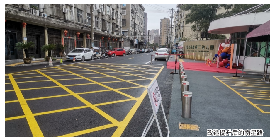
改造提升后的南星路

本报讯(记者 金汝)昨日上午,记者来到莘塍第二幼儿园门前的南星路,只见沥青道路干净平整、标线清晰,机动车有序停放在两侧的停车位上。这条道路长386米,与市场南路相连,周边是居民区,是进出莘塍第二幼儿园的必经之路。过去该道路为水泥路面,因为建成时间较久,路面不平整,出现多处坑洼,给师生、周边住户出行带来极大不便。