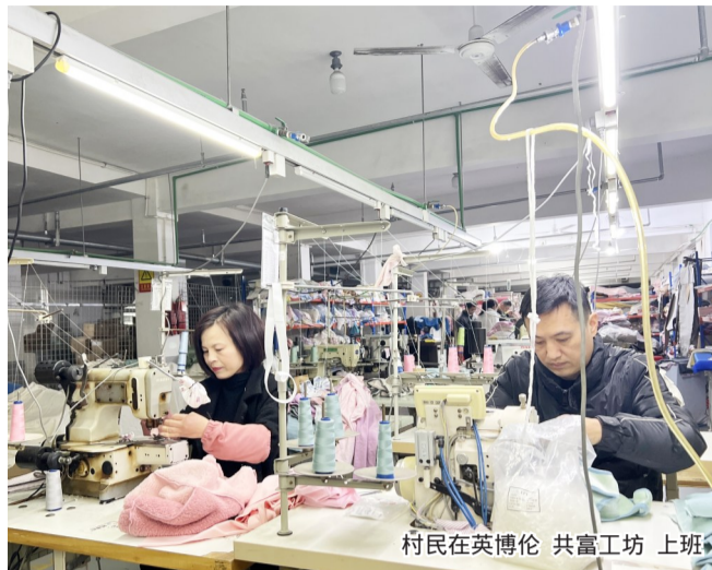
村民在英博伦共富工坊上班

定向招工式、品牌带动式、农旅融合式、电商直播式 这些共富工坊,每一家都有自己的特色,是该街道探索实施1+1+3+X党建联建机制和三个一联系制度,通过组织牵线、平台搭建、技术培训等举措,因地制宜精心打造而成。它们的建成,辐射带动周边1300余人就业,让上望逐步形成人人有活干、家家有收入的共富新图景。