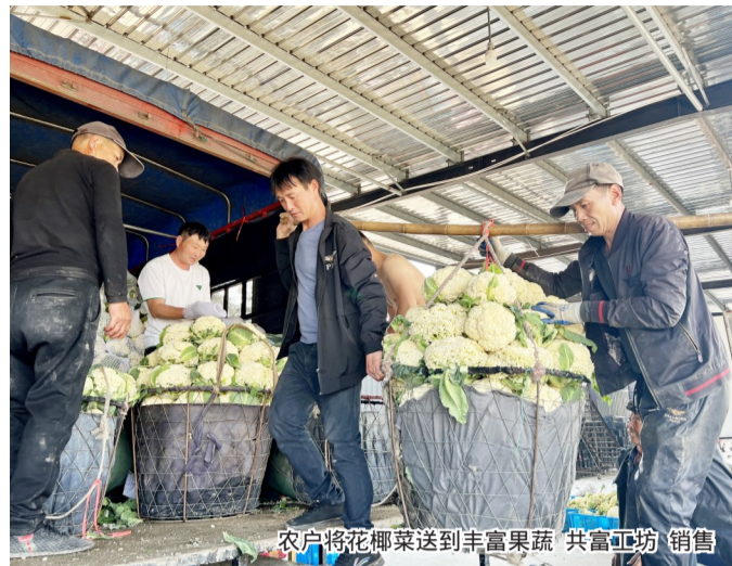
农户将花椰菜送到丰富蔬果共富工坊销售