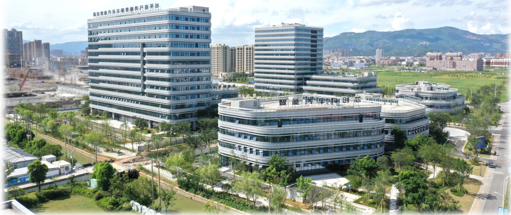
东新科创园

云江奔腾、浩荡向海。东海之滨、新城生长。一片创新活力迸发的产业高地，一座三产协调发展的宜居新城，一个共建共享共享的品质之都，应势而起、顺势而兴。