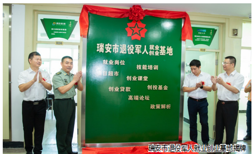
瑞安退役军人就业创业基地揭牌

该局相关负责人表示,退役军人就业创业是该局一项长期的重点工作,下一步将加强政策宣传,优化就业结构,提升就业质量,增强就业服务能力。同时,与人力资源机构和用人单位加强联系沟通,不定期组织线上线下招聘活动,为退役军人和家属搭建优质、便捷、高效的就业服务平台,确保退役军人稳定、高质量就业。