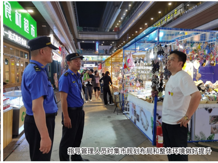
指导管理人员对集市规划布局和整体环境做好提升