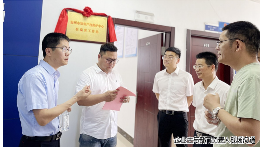
企业与部门负责人现场沟通