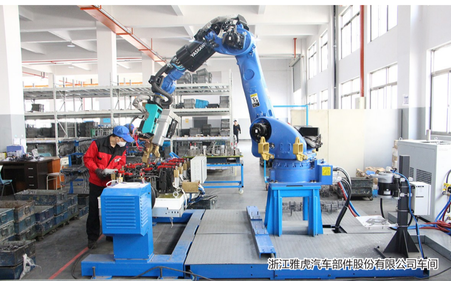
浙江雅虎汽车部件股份有限公司车间

本报讯(通讯员 欧永春 记者 项颖)近日,省经信厅、省财政厅公布了“浙江制造”省级特色产业集群核心区协同区财政专项激励名单,我市节能与新能源汽车及零部件产业集群(底盘系统)入选,将获得1000万元资金奖励。