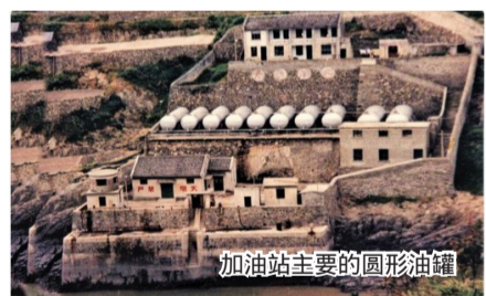
加油站主要的圆形油罐

北麂加油站虽然只存在了13年多,但在为渔民提供便利、做好服务的同时,也见证了北麂岛的发展,并为北麂渔业的发展作出自己的贡献。